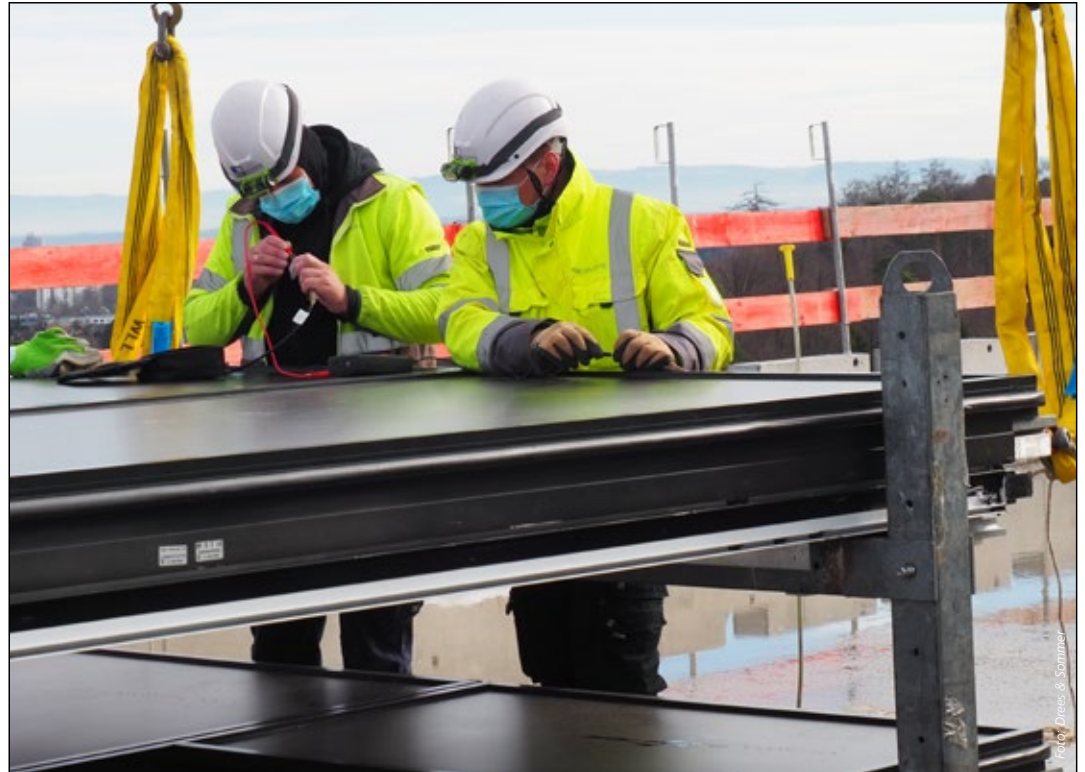
Erstmals im Neubau von Drees & Sommer eingesetzt